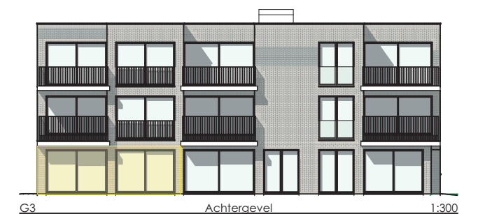
G3 Achtergevel 1:300