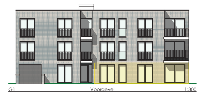
G1 Voorgevel 1:300

APPARTEMENT 0.4 BVO 67,55 m 2 || TUIN 161,49 m 2 || TERRAS 24,23 m 2 || BERGING (nr. 8) 5,35 m 2