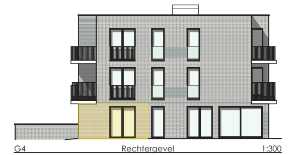
G4 Rechtergevel 1:300